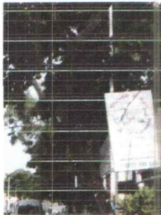
Foto 3. Vista lateral del Macuilis donde se encuentra inclinación del árbol pronunciada.