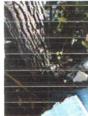
Foto 4. La inclinación del tronco empieza hacer pronunciada provocando la destrucción de la pavimentación y guarnición