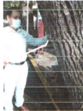
Foto 2. Visita de inspección técnica de una especie arborea, ubicado en la Av. Paseo Tabasco No. 314